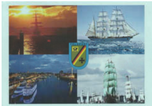
Wilhelmshaven WEAdJ 02.07.22