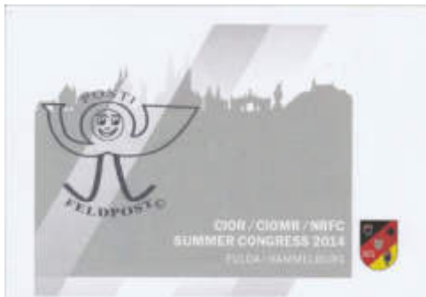
Fulda 08.08.14 CIOR SUMMER CONGRESS