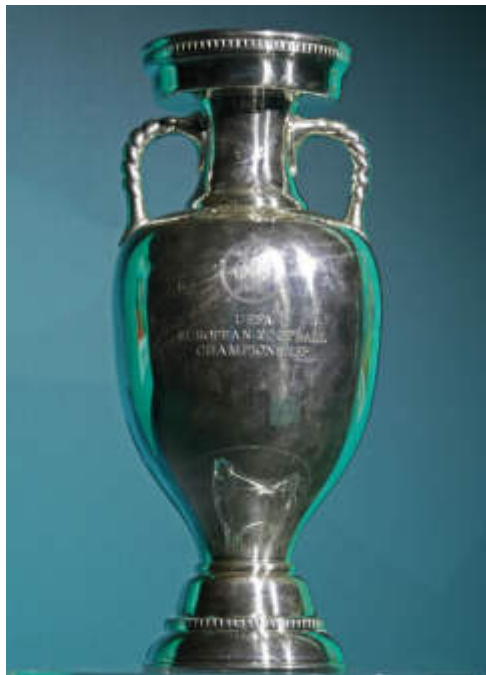
Der EM-Pokal.